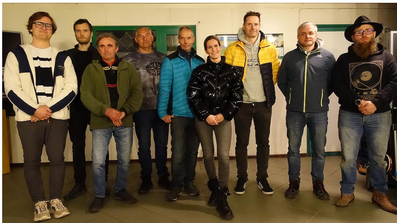
Zarząd 2026-2029 (fot. z roku 2026)