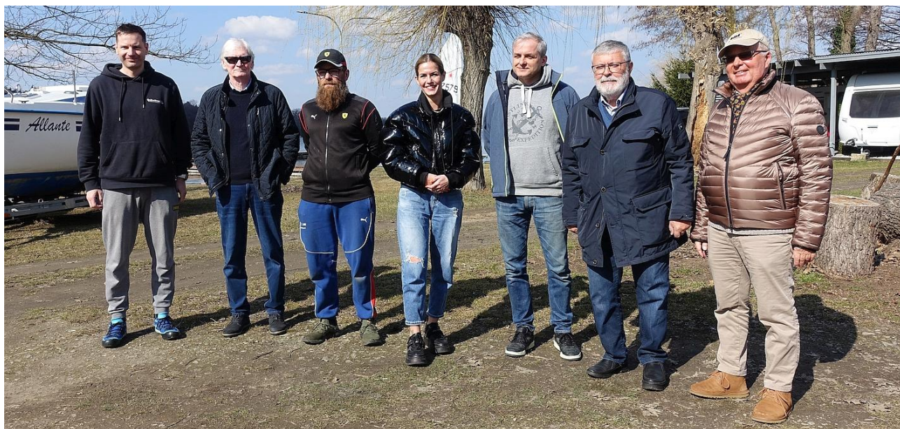
Zarząd 2022-2025 (fot. z roku 2026)