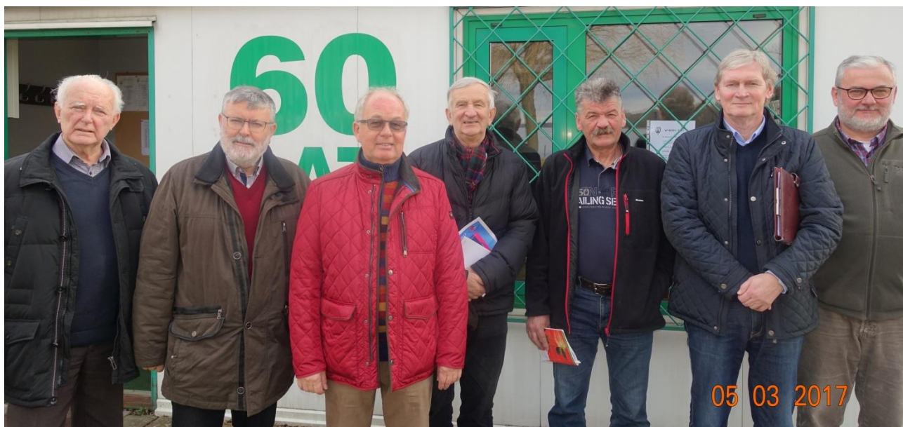
Zarząd 2013-2016 (fot. z roku 2017)