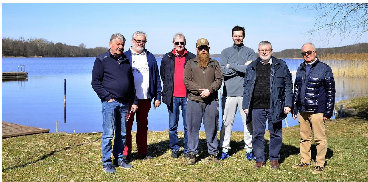
Zarząd 2017-2021 (fot. z roku 2022)