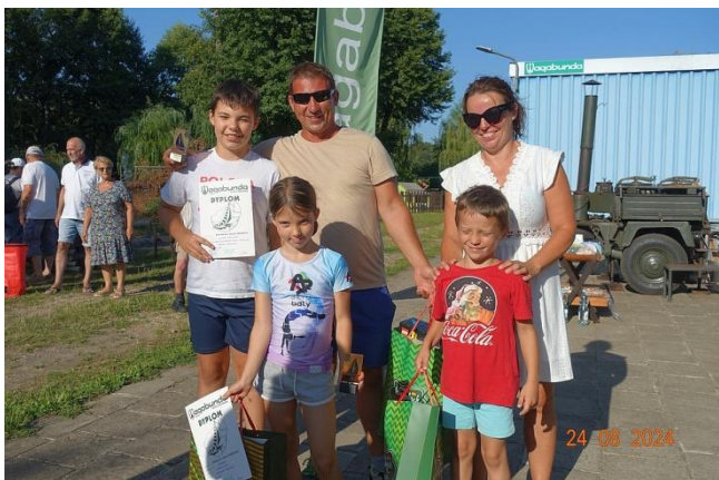
Fot3. Migawki z regat o memoriał Sławka Dabińskiego